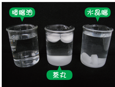
樟腦油(左)，萘丸(中)浮在鹽水上，水晶腦(右)沉入鹽水中。

發生誤食意外，有些家長在孩子一邊哭噎時，常會挖喉催吐，這是很危險的動作！一般不建議民眾自行催吐，特別是孩童或病人意識不清楚的狀況下，因催吐可能會讓毒物（異物或液體）嗆到氣管中，造成吸入性肺炎，嚴重者還會導致窒息。