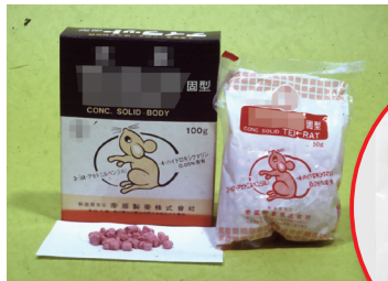
形狀似小顆糖果的滅鼠藥。

許可證字號： 環署衛製字號：[REDACTED] 品名：[REDACTED] 有效成分及含量： 雙滅鼠(Difenacoum) --0.1% 性能：防治家鼠 劑型及內容量：50g