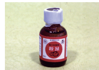
似小瓶雞精的滅鼠液劑。

餅狀的滅鼠藥餌劑通常顏色鮮豔，形狀做得像餅乾、巧克力片，所以這些滅鼠藥如果擺放的位置不適當，或是沒有特別注意時，往往容易被誤食；也有人曾把滅鼠藥的液劑看成是小瓶的雞精，各種誤食的狀況層出不窮。因此擺放滅鼠藥時，除了放在老鼠常經過的地方，也要考慮一般人伸手不易拿到的地方，特別是孩童與失智的老人。收納時也應在外包裝標示清楚，否則也會讓一般人有意誤食的機會。